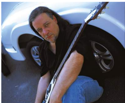
Neal Black

L'un des artistes américains les plus importants de la scène Blues actuelle. Sa musique, un Blues-rock incisif , est enracinée dans la tradition du Texas, mais Neal Black n'est pas un imitateur. Plus de 25 ans de carrière, surnommé " le maître du Texas boogie ", ce brillant guitariste puise aux racines du Blues pour créer son propre style. Il s'est produit dans le monde entier, a collaboré avec Taj Mahal, Popa Chubby et bien d'autres stars. Il possède une voix grave, rauque, très rocailleuse et puissante tout à fait particulière. Son jeu de guitare est aussi éblouissant en jeu électrique qu'en jeu acoustique. Il est un novateur, un auteur-compositeur doué et un guitariste hors du commun doté d'une incroyable technique .